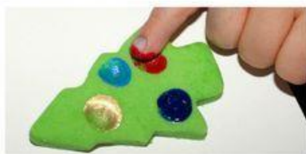
fingerprint Christmas Tree

Ujjfestés: nagyon egyszerű, kevés eszköz szükséges hozzá és látványos. Az alsó képen egy cukorbot, míg a jobb oldalon egy levegőre száradó színes gyurma-dísz látható.