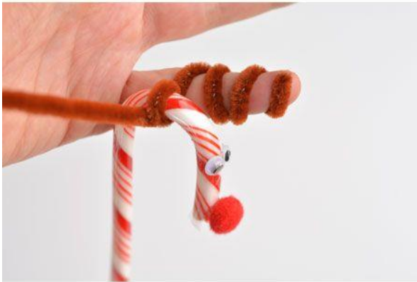
CANDY CANE REINDEER onelittleproject.com